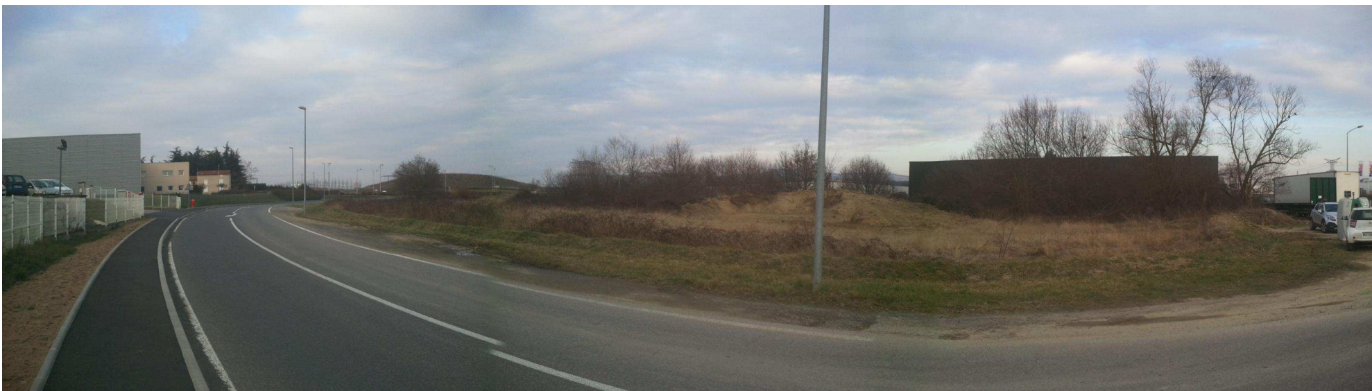
Ensemble des parcelles reclassées en zone Ui, le long de la Rue du Parc d'activités

Les prescriptions suivantes s'appliquent pour les parcelles aux références cadastrales BE67 et BE 66.