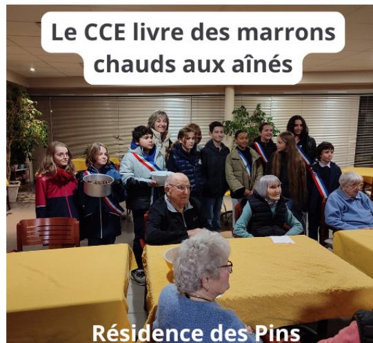
Le CCE livre des marrons chauds aux aînés