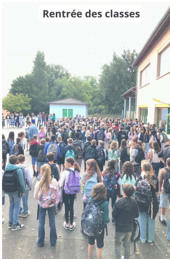
Rentrée des classes