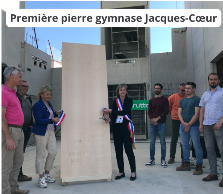
Première pierre gymnase Jacques-Cœur