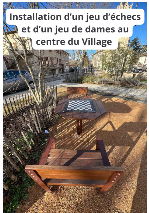
Installation d'un jeu d'échecs et d'un jeu de dames au centre du Village