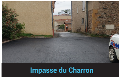
Impasse du Charron