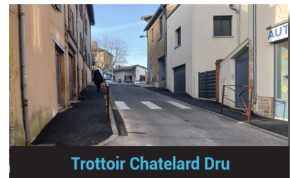
Trottoir Chatelard Dru