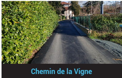
Chemin de la Vigne

Les travaux ont consisté à reprendre la gestion des eaux pluviales, à refaire la bande de roulement ainsi que le trottoir : Chemin de la Vigne, Impasse du Charron et rue Chatelard Dru.