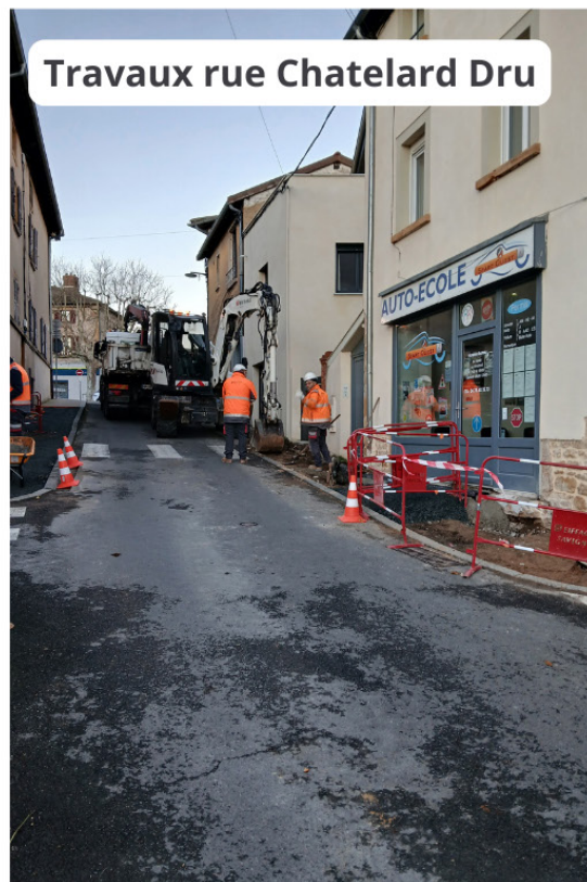
Travaux rue Chatelard Dru