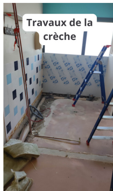
Travaux de la crèche