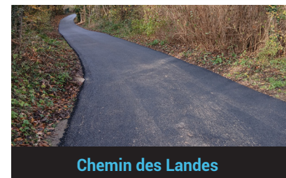
Chemin des Landes

Le Chemin des Landes était très dégradé. La bande de roulement a été reprise depuis la RD7.