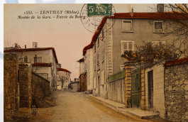
4 - Château du Bourg