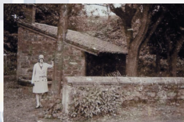
2 - La Grand' Croix